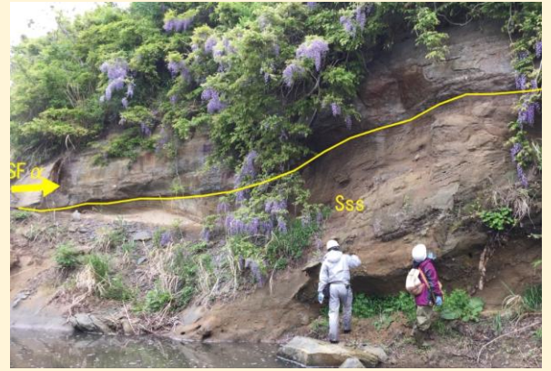
原発南側の夫沢川での地質調査（口絵より）