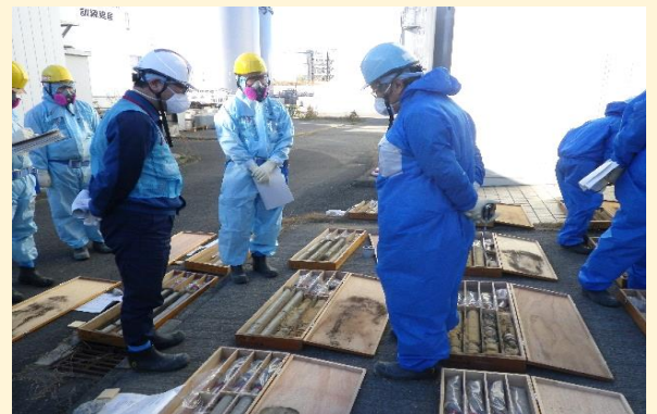
敷地内のボーリングコアについて 東電と質疑（口絵より）

この専報が福島第一原発事故後10年の現状と課題をまとめた一つの記録集になるとともに、今後の安全で確実な汚染水対策や廃炉作業の計画と実施の一助となり、さらには原子力発電の危険性や問題点を地質や地下水の観点から指摘した専門書として広く活用されることを期待しています。