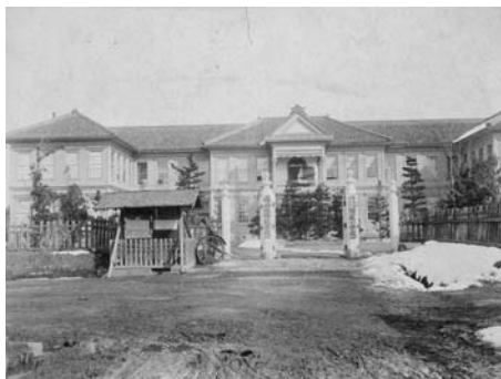
福島県師範学校正門写真

福島県師範学校は人間発達文化学類の前身で、1897（明治30）年の師範教育令により福島県尋常師範学校から校名変更したものである 1) 。写っている校舎は1888（明治21）年に作られた舟場町校舎で、堅牢且つモダンな校舎は「東北随一」といわれた 1) 。写真は掲示板の生徒募集と入札広告の張り紙の日付から明治時代（年月日は読み取れず）のものと思われる。台紙に田村鐵三郎の印が印刷してある。田村は福島で最も初期に活躍した写真師で、福島市宮町に店を構え、『福島県写真帖』 2) などに明治から大正期の県内各地の景観や建造物の姿を記録している。