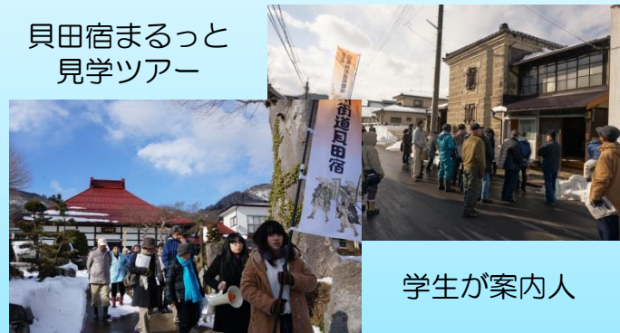
貝田宿まるごと 見学ツアー