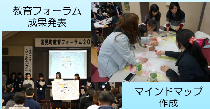
教育フォーラム 成果発表

桜の聖母短期大学 「くにみ未来まちづくりワークショップ」 ～子どもたちのファシリテーター～