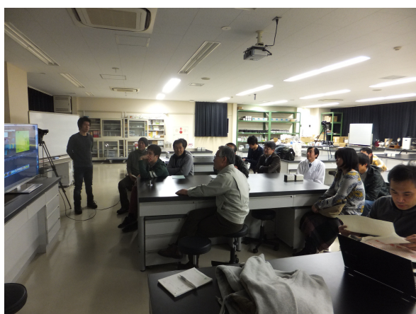
試写会の様子（映像鑑賞中）

放送はNHKのBS番組で、4月中を予定されているそうです。プロジェクト研究所の皆さんも是非ご覧頂ければと思います。