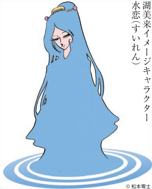
湖美来イメージキャラクター 水恋(すいれん)