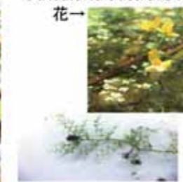
Utricularia australis R.Br.

花一 一殖芽 瑠璃沼のみ 環境省RL準絶滅危惧種 ヒメタヌキモよりも大きく、捕虫囊が多い 花の写真は福島市内のもの