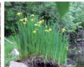
Iris pseudacorus L.