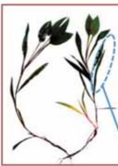
フトヒルムシロ Potamogeton fryeri A.Benn.

ヒルムシロ科の浮葉植物。オヒルムシロと似るが沈水葉の形で両者を区別する。酸性の水域にしか生育できず、pHの上昇を伴う水質汚染に弱いとされている。毘沙門沼のほかに深泥沼、竜沼で見られる。