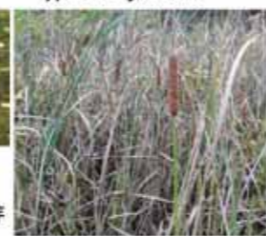
Typha latifolia L.