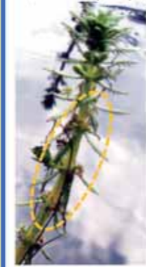
フサモ Myriophyllum verticillatum L.

アリトウグサ科の沈水植物。熱帯魚屋で金魚藻として売られているホザキノフサモとは別種。貧栄養で酸性の水を好む。左:フサモの花 右:フサモの水中部分の茎と葉