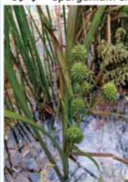
ミクリ Sparganium erectum L.