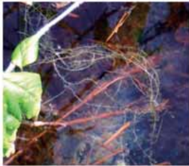
ヒメタヌキモ Utricularia minor L.

タヌキモ科の食虫植物。微小な捕虫囊で水ごと吸い込んで小さな動物を捕獲する。貧栄養の水質を好む。毘沙門沼の他に深泥沼、弁天沼でヨシ群落のへりなどに見られる。