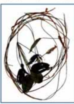
オヒルムシロ Potamogeton natans L.

ヒルムシロ科の浮葉植物。五色沼湖沼群では毘沙門沼の他に深泥沼、弁天沼などでみられる。左:さく葉標本, 上:浮葉と花(深泥沼)