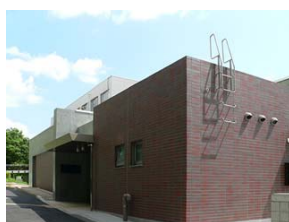
福島大学キャンパスマップ（上）と共生システム理工学類後援募金記念棟の写真（下）