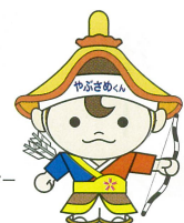
古殿町 キャラクター やぶめくん